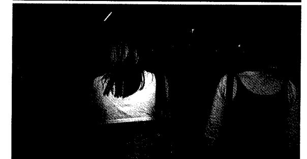
Obisk Mikroanalitskega centra

Vsem koordinatorjem se želim najlepše zahvaliti za trud, za izjemno dobro voljo, ki so jo izkazovali ves dan, ter za vso pripravljenost za sodelovanje. Dan je minil ne samo brez zapletov, ampak tudi prijetno! Ker je sijalo sonce, smo se koordinatorji z veseljem zadrževali pri vratarnici – izkoristili smo priložnost za sončenje na delovnem mestu, saj je nimamo pogosto.