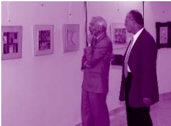
Prof. dr. Jean–Marie Lehn si je s zanimanjem ogledal razstavo Fausta Melottija v galeriji IJS.