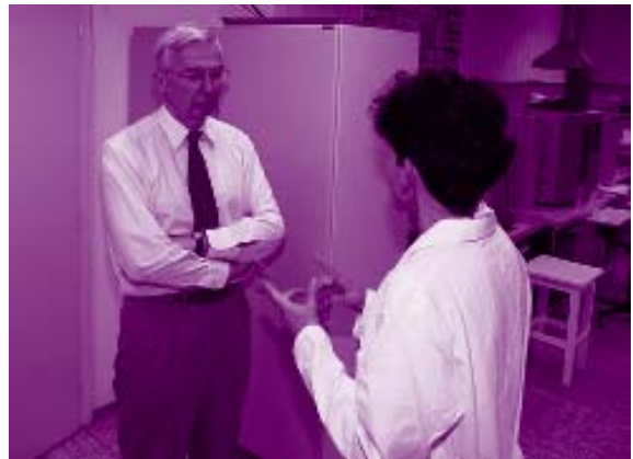
Ogled laboratorijev Odseka za znanosti o okolju